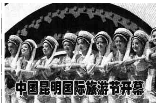
中国昆明国际旅游节开幕

4月10日上午,几辆自卸车正在向三峡工程临时船闸上游引航道内倾倒砂石料。当天,三峡临时船闸正式关闭,三峡临时船闸改建冲沙闸工程正式开工。三峡临时船闸改建冲沙闸工程,是2003年三峡工程实现水库初期蓄水、永久船闸通航、首批机组发电三大目标的骨干工程之一,计划于2006年4月完工。