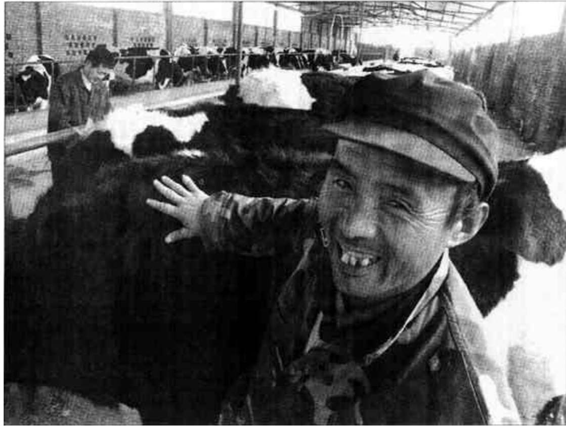
东营区黄河路街道积极发展畜牧业，以原野养殖小区为龙头，加大了规模养殖小区的建设，突出优质奶牛的规模化养殖，现已发展优质奶牛200余头。

事实证明，招商引资是加快区域经济发展的必由之路，是富民强市的关键之举，是东营人民安居乐业的可靠保证，是实现持续发展的希望所在。全市上下特别是广大党员、干部，一定要从事关东营的前途命运、事关全市人民根本利益的高度，充分认识搞好招商引资工作的极端重要性，坚定信心，乘势而上，迅速掀起招商引资新高潮，以招商引资的新突破，推动经济社会的大发展。