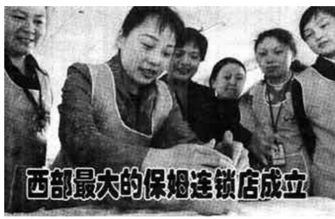
西部最大的保姆连锁店成立

4月9日,常州市的舞龙高手进行舞龙彩排。当天,一条堪称目前国内最大的龙灯在这里亮相。据介绍,该龙灯全长200米,共100节,由数位龙灯爱好者耗时20多天,用竹篾、彩帛等原料以传统工艺扎制完成。据悉,这条被命名为“龙城龙”的长龙将参加即将举行的“第三届江苏省园艺博览会”开幕式及“百龙大赛”,并准备申报世界吉尼斯纪录。