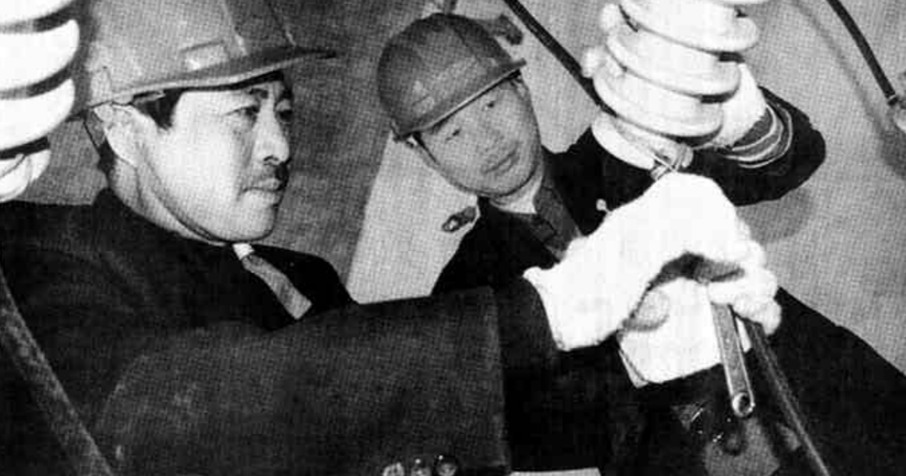
广饶县石河镇为保障农民搞好春季农业生产，最近组织人员对全镇农用线路进行了一次彻底检修，保证农用线路安全畅通。

2002年，民盟东营市委确定了“开拓创新、向实发展”的基本工作思路，努力调动全体盟员的积极性，充分发挥盟员优势，积极参政议政。